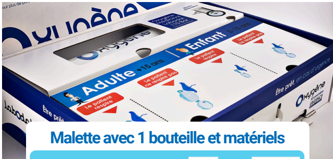
Malette avec 1 bouteille et matériels