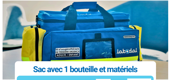
Sac avec 1 bouteille et matériels