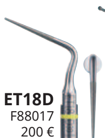
ET18D F88017 200 €