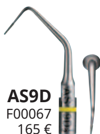
AS9D F00067 165 €