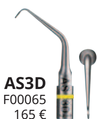
AS3D F00065 165 €