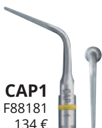
CAP1 F88181 134 €