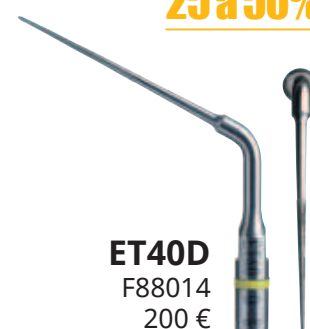
ET40D F88014 200 €