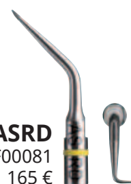
ASRD F00081 165 €