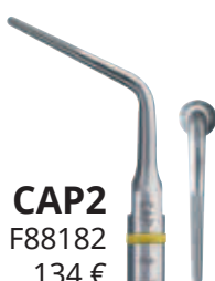
CAP2 F88182 134 €