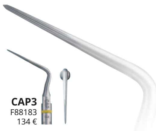
CAP3 F88183 134 €