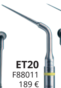
ET20 F88011 189 €