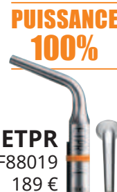
ETPR F88019 189 €