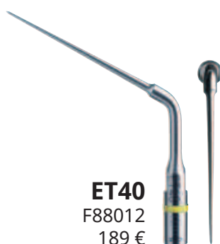
ET40 F88012 189 €