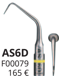
AS6D F00079 165 €