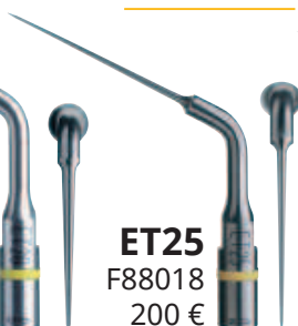
ET25 F88018 200 €