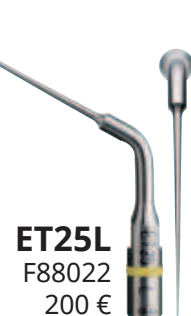
ET25L F88022 200 €