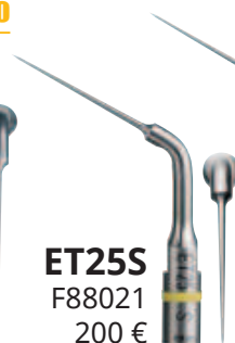
ET25S F88021 200 €