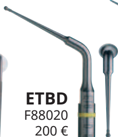
ETBD F88020 200 €